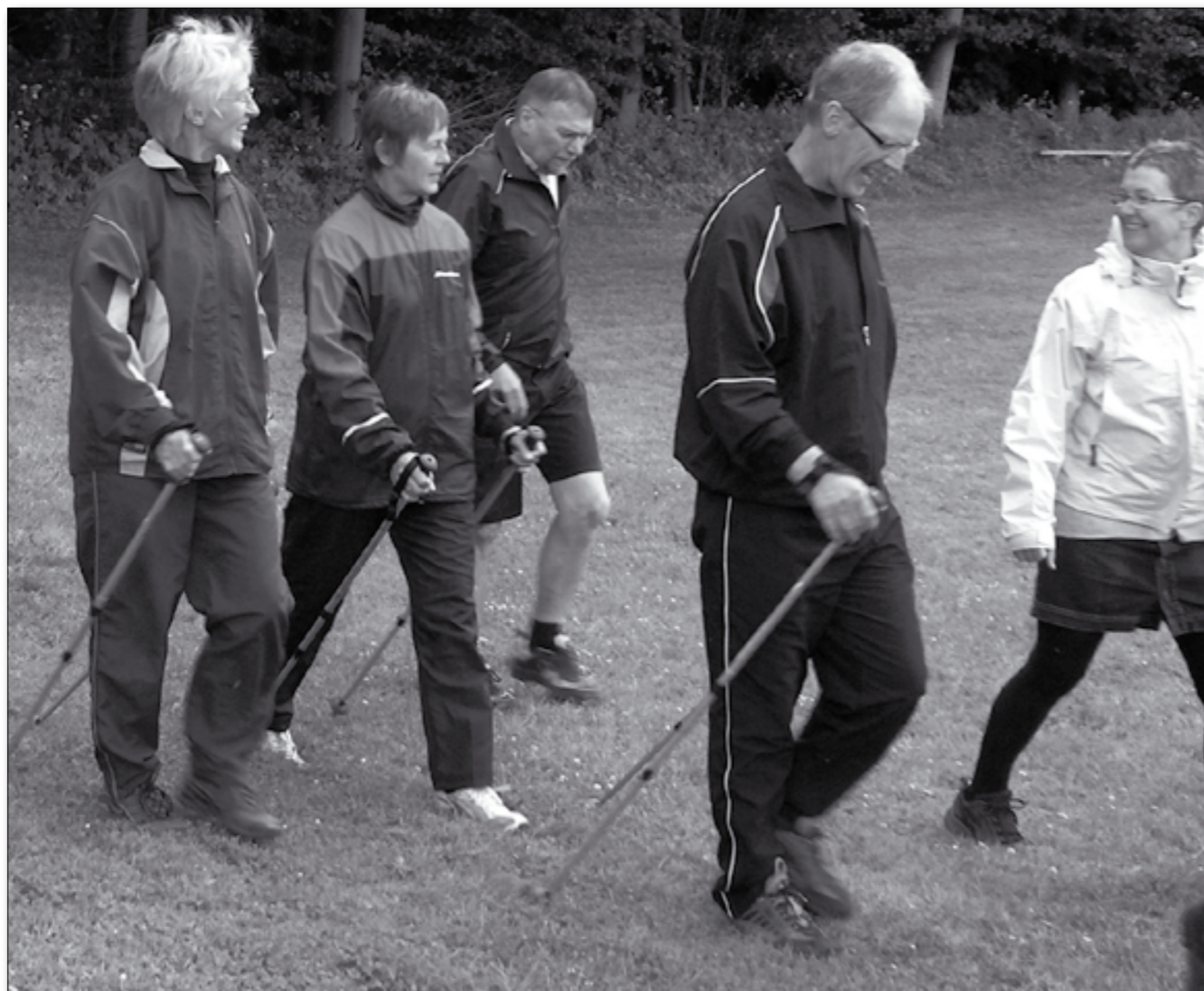
Stavgang er en vældig effektiv motionsform, når det gælder om at forebygge knogleskørhed

Knoglerne skal styrkes, ligesom muskler, men det kræver, at de bliver påvirket gennem belastning. Styrketræning er effektivt, når det gælder forebyggelse af knogleskørhed. Man