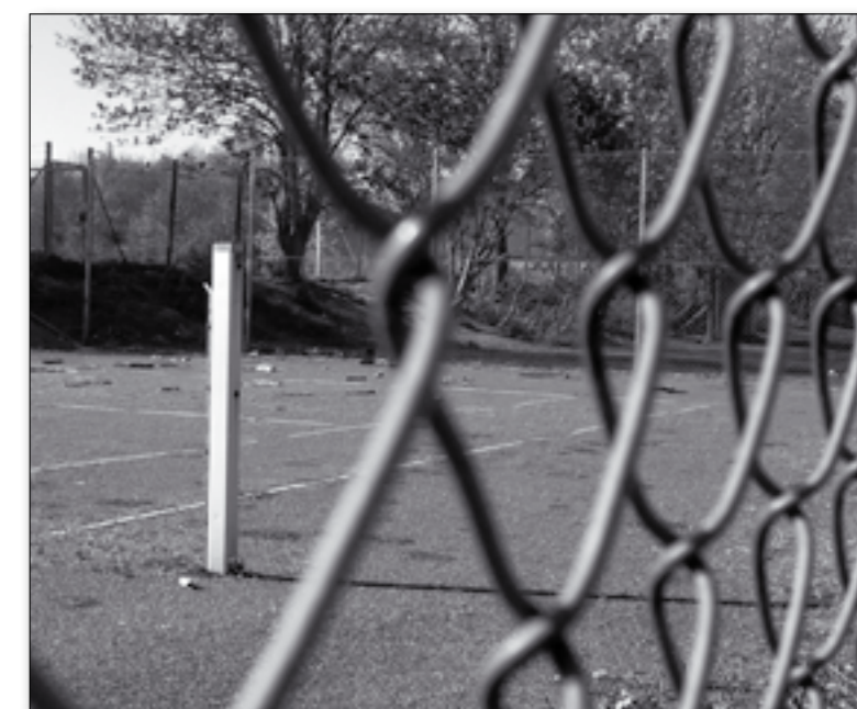
I år foregår tilmeldningen på tennisbanerne søndag 11. april.

Der holdes opstillingsmøde til tennisafdelingens bestyrelse torsdag 18. februar kl. 19 i Hatting klubhus.