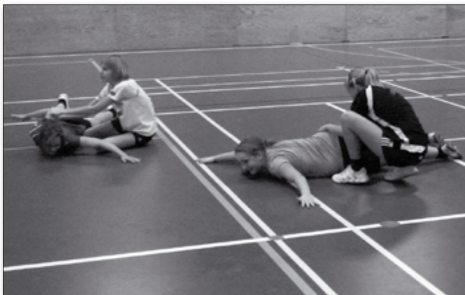
Håndboldafdelingen i Hatting Idrætsforeningen summer af liv og sportslig udvikling.

Som noget nyt afholdt vi i efterårsferien håndboldskole i samarbejde med