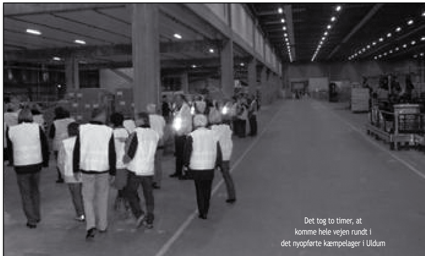
Det tog to timer, at komme hele vejen rundt i det nyopførte kæmpelager i Uldum

En stor tak til Jysk for medvirken til dette arrangement.