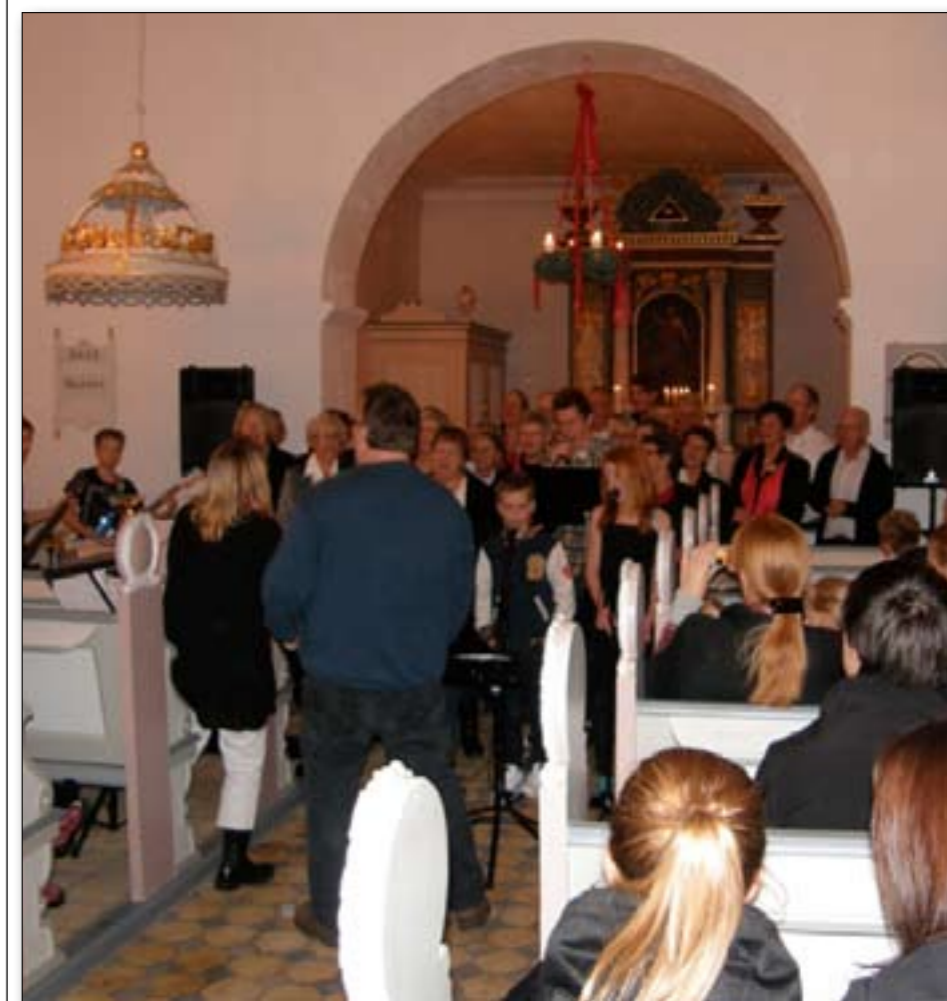
Julekoncerten er en stor kirkebegivenhed i Hatting Sogn.

I år blev den traditionsrige julekoncert i Hatting kirke afviklet 20. december - Alle kirkens musikkræfter kom til udfoldelse - hvilket vil sige bandet med kor,