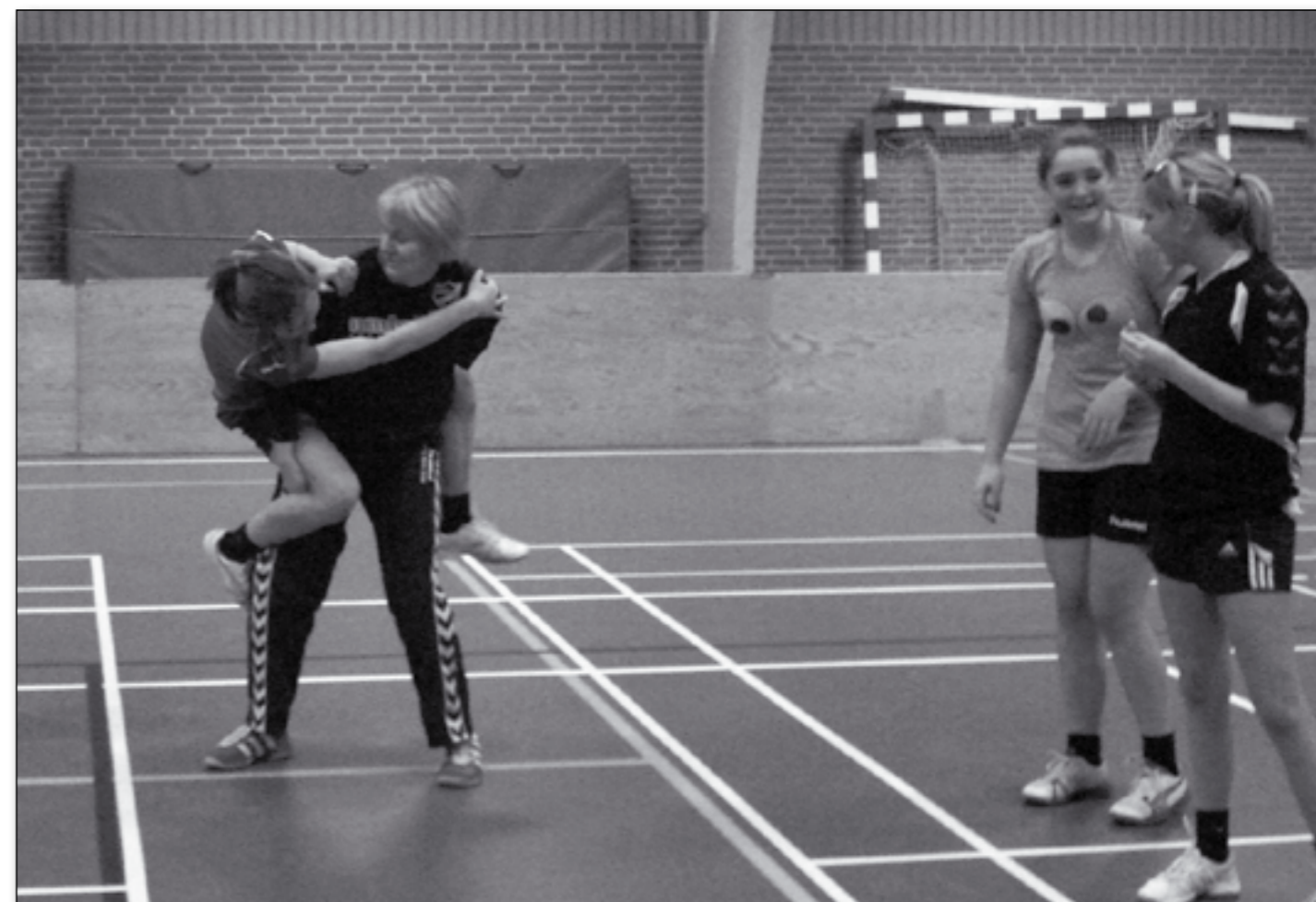
Der var masser af forskellige øvelser til pigespillerne fra U12 og U14 holdet.

Tak til vores sponsorer, som har gjort, at begge herre hold i år har kunnet anskaffe sig nye spillesæt. Og til alle Hatting borgere - følg med i, hvordan det går holdene på infosport og mød op til vores hjemmekampe og støt håndbolden i Hatting.