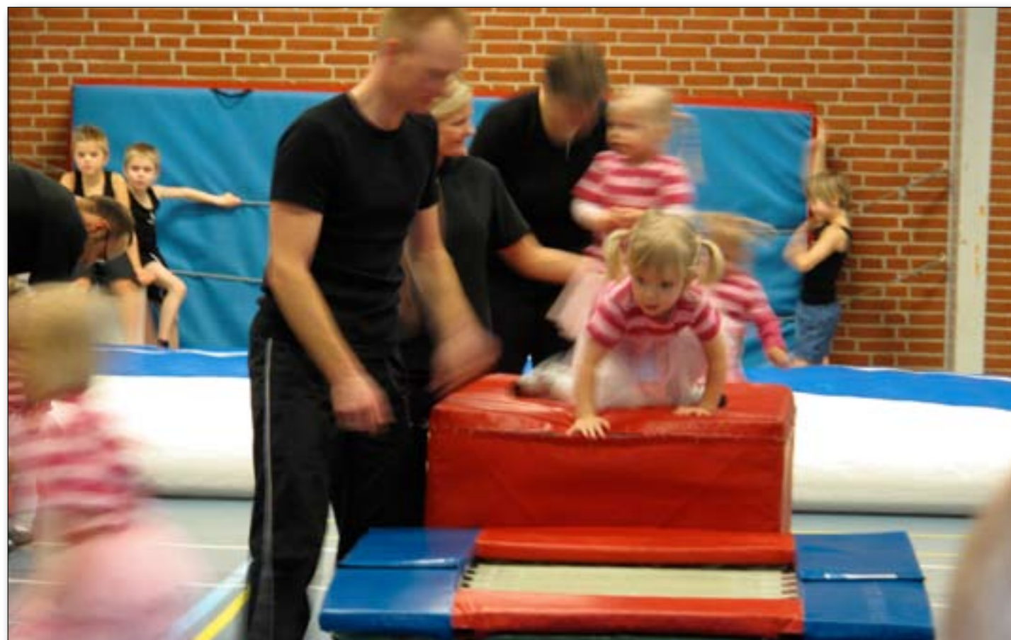
Lige som sidste år lægger Hatting hallen gulv til gymnastikopvisningen. I år er det søndag 7. marts.