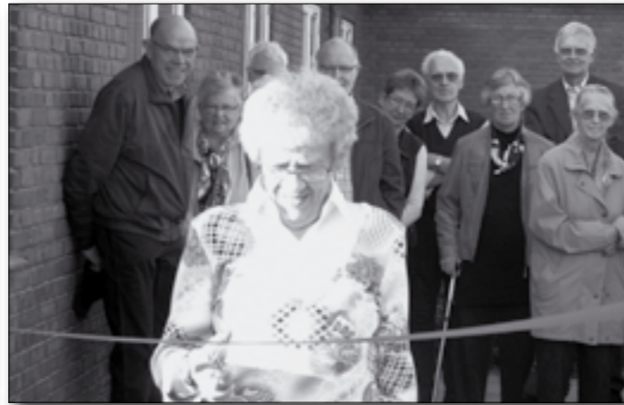
Det var - naturligvis - en af Hattingcentrets beboere, der klippede den røde snor over og formelt indviede Sanshaven.