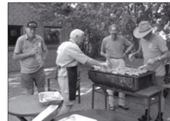
Barbecue er et »must«, når man har besøg fra Texas - så sådan en blev der selvfølgelig plads til.

Vi havde tre skønne døgn sammen, hvor vi bl.a. var på Himmelbjerget, i Skipperparken i Juelsminde og på Hjørnø, hvor vi havde arrangeret det, så vi kunne være indendørs i tilfælde af regnvej. Men vejrguderne var med os alle dagene. Sejlturen til Himmelbjerget fra Ry kunne ikke være smukkere og ørundturen på Hjørnø var