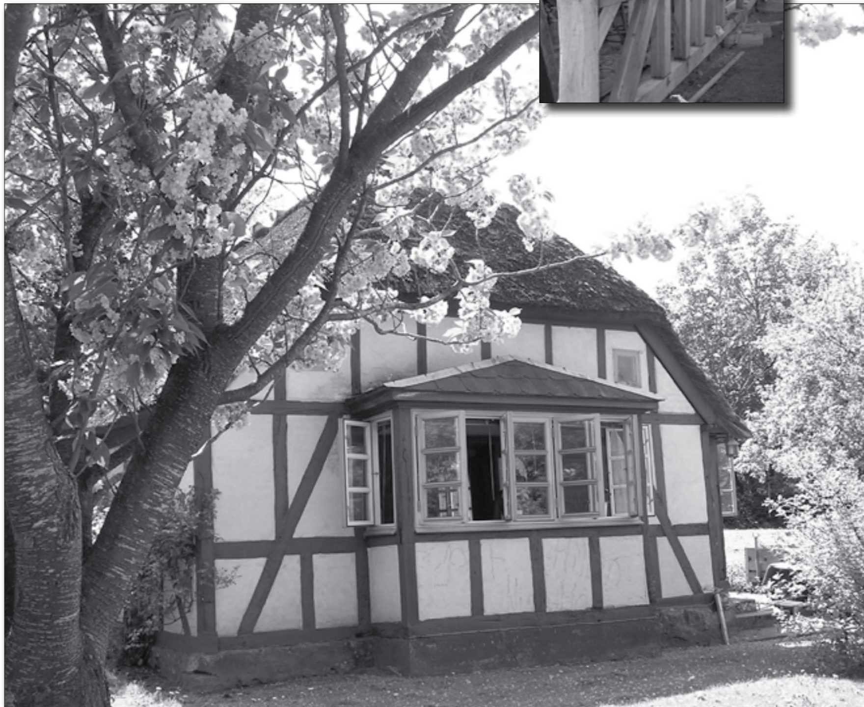
Det lille idylliske hus ved kirken bli'r nu sat i stand fra inderst til yderst.