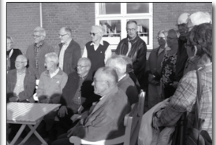
Selvom de mange frivillige bag projekt Sanshaven er beskædede, lod de sig dog lokke til at stille op til et gruppefoto.