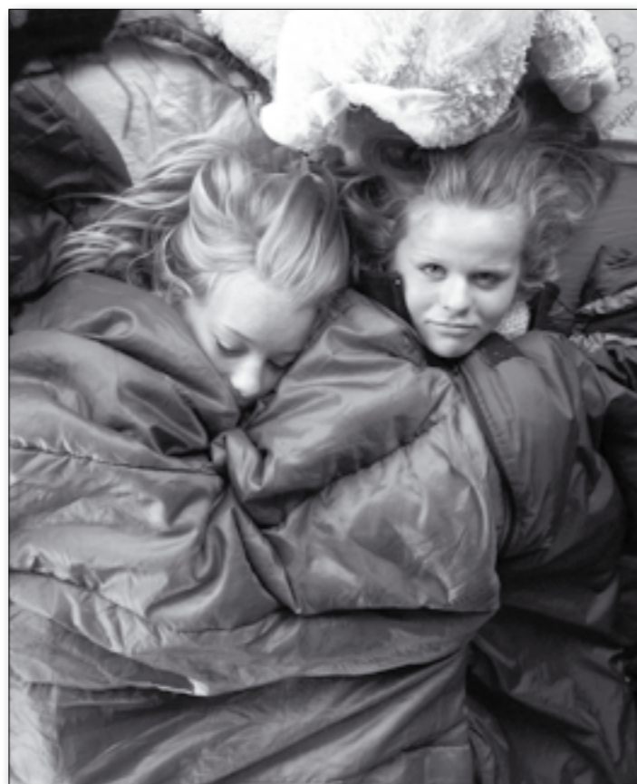
Lykken er..... at soveposerne kan lynes sammen.

Vi er nu kommet godt i gang med det nye spejderår, og glæder os i skrivende stund til vores kommende gruppetur, hvor hele gruppen med både store og små spejdere drager til Ravnsø sammen.