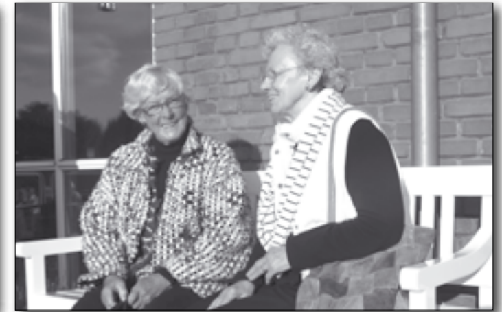
Efterårsvejret viste sig fra sin smukkeste side, da Sanshaven blev indviet. En perfekt ramme om en hyggelig sludder på bænken.