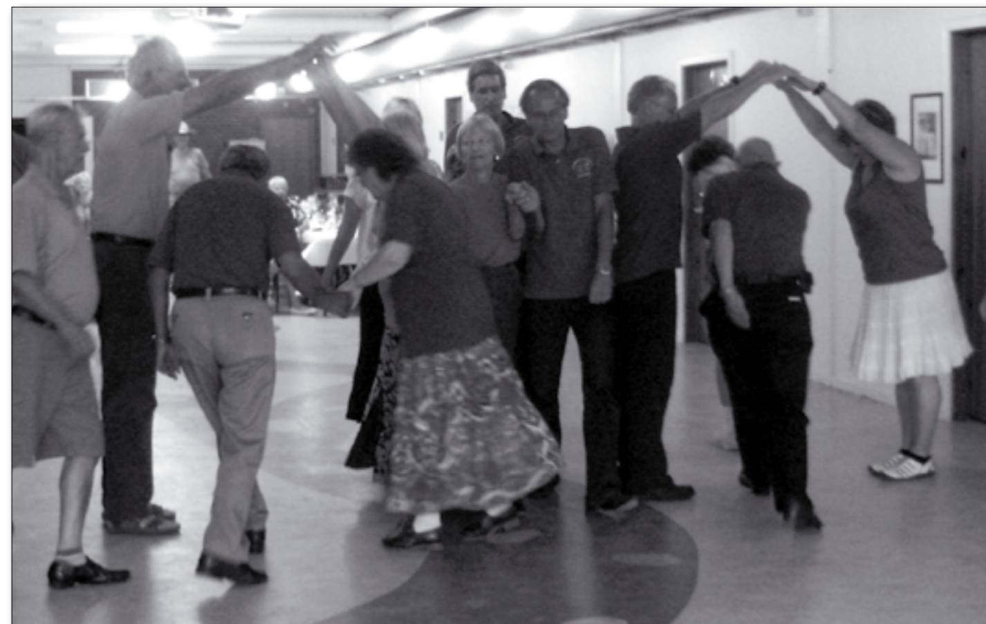
Scandinavian Folk Dancers fra Huston i Texas gav en opvisning på Hattingskolen, da de besøgte de lokale folkedansere i sommer.

Og HUSK! På Hattingbladets hjemmeside www.hattingbladet.dk kan du følge med i, hvornår der spilles kampe i hallen.