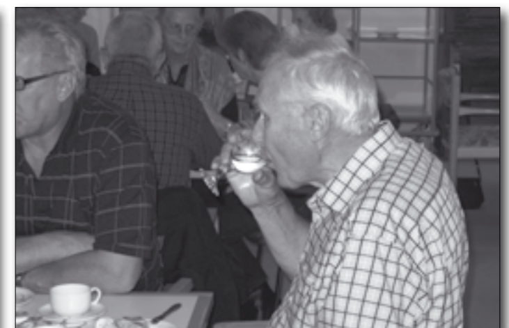
En skål for Sanshaven. Super Brugsen bakkede også op om havens indvielse ved at sponsorere øl, vand og vin til festlighederne.