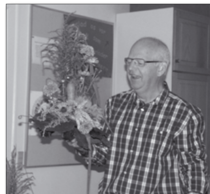
Der blev budt flittigt ved årets høstauktion - bl.a. på denne smukke og kreative dekoration, der indeholdt både blomster, en gulero og en porre.