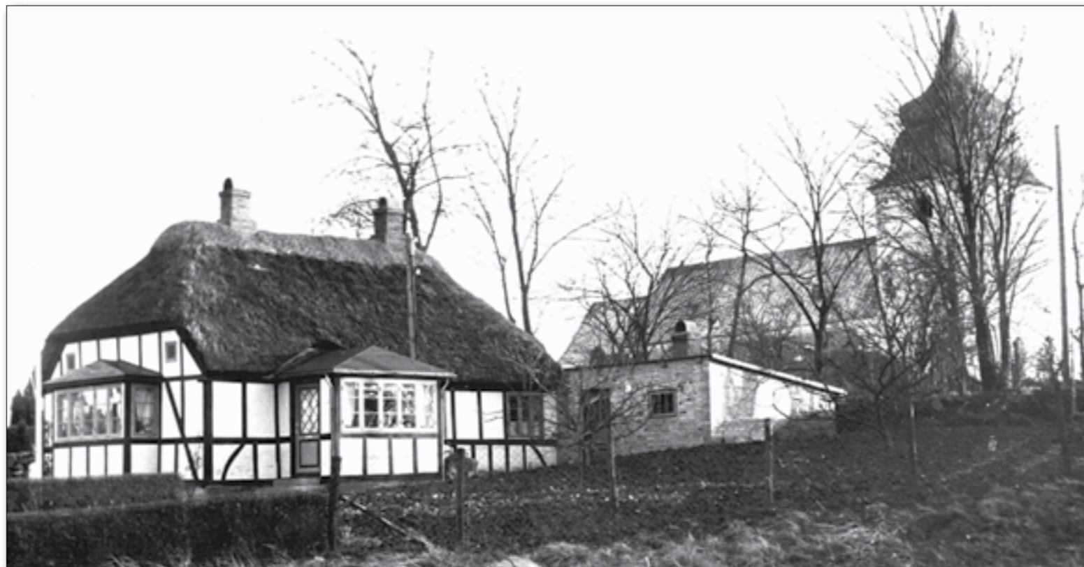
Et billede fra ca. 1950. Bemærk el-masten, lige bag vindfanget. Strømmen kom nede fra præstegårdens område; el-ledningerne fulgt ikke vejen. Vi har fundet forankringer til master både i diget ind til kirkegården, og i det gamle dige.

engang i 1940'erne, og en del af materialerne er gået til den fine karnap og vindfanget, som er sat på huset. Det er nu ikke det første genbrug, der er i huset. Meget af bindingsværket har været brugt andre steder før; man kan se det på de huller, der er lavet i det – huller, som umuligt kan have haft en funktion, der hvor det sidder nu. En stump ser endda ud til, at den har været med i en brand. Træet har endnu haft styrken i sig, og det er derfor blevet brugt. At det var lidt forkullet har ikke betydet noget. Måske har det endda næsten været en fordel, for træ-ædende biller og utøj holder ikke af at tygge i trækul.