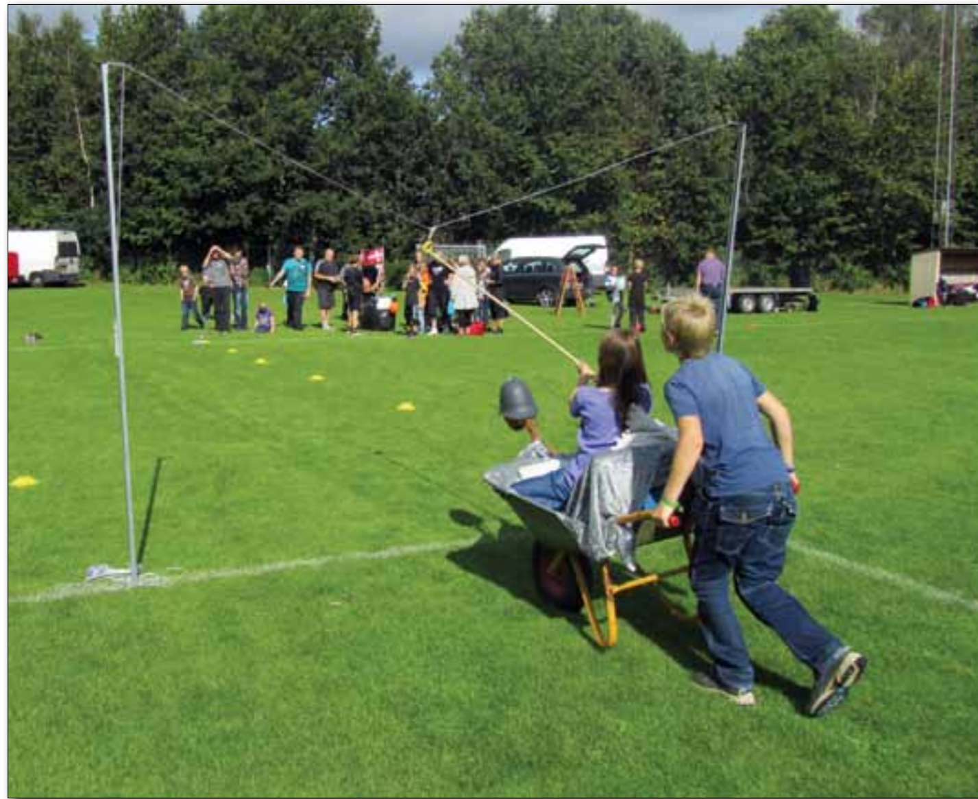
Byfesten bød på trillebørs-ringridning. Der var også præmier til den pæneste pyntede bør.