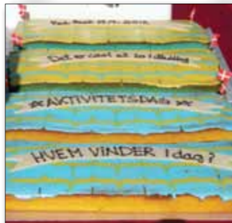
»Det er cool at bo i Hatting«. Ja, det budskab kan vi alle nok blive enige om :-)

Næste års byfest er allerede fastlagt til d. 07.09.13.