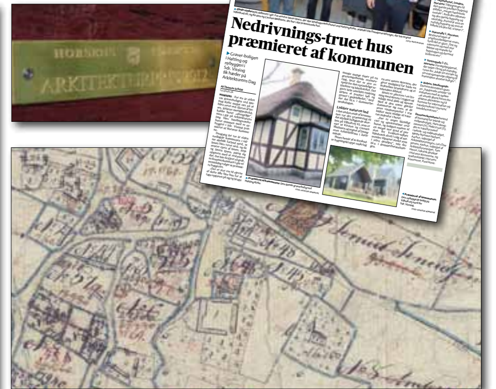
Artiklen fra Horsens Folkeblad om den fine arkitekturpris samt den blanke messingplade, der nu pryder huset. Det gamle kort viser Hatting by. Kortet er med rettelser, da det har været gældende fra 1819 til 1850. Mange af markeringerne er diger, og ikke veje.

Da vi gravede ud inde i huset, stødt vi på flere store sten. En del lå pænt på række, og lignede enten en stump dige, eller resterne fra en sokkel. Efter den gamle tegning kan det være, at vi er stødt på sokkel fra den gamle stald, eller også er det der, hvor diget engang lå. Der er blevet rykket lidt rundt på tingene igennem årene. I jorden fandt vi også mange gamle skår fra tallerkner og glas, og en enkelt jubilæumsmønt fra Horsens 500 års Købstadsjubilæum i 1942. Der var også lidt knoglerester, sikkert rester fra måltiderne. (Vi fandt også nyere ting under gulvet, men det skyldtes rotterne, der havde haft adgang til skraldespanden, og hentet meget "lækkert" mad der) De gamle ting som vi fandt, ligner meget de ting, der