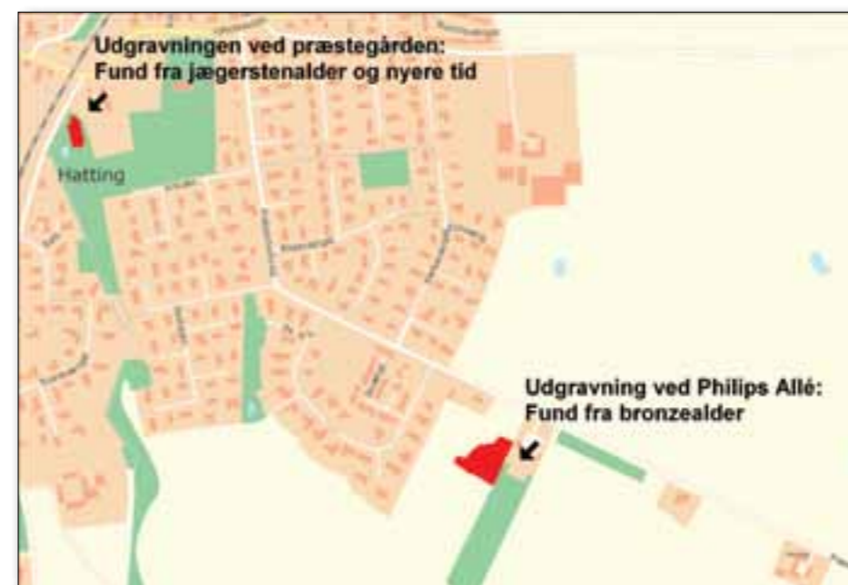
Kortet viser, hvor Horsens Museum har gravet i Hatting i 2012.

Den store bygning fundet ved Præstemarksvej er her vist med landmålerstokke og barberskum. Det store hus dannede rammen om en bronzealderfamilies liv og landbrug for over 3500 år siden. Hallen har fortsat ind under haverne bagerst i billedet.