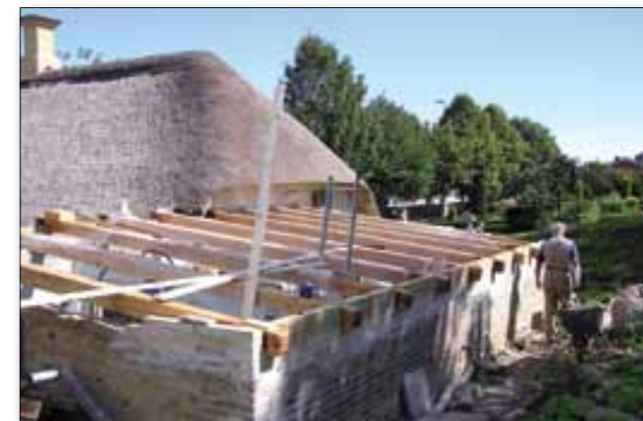
Den nye tagkonstruktion, med de nye kraftige bjælker

blev fundet i jorden, der hvor der er udgravninger ved bækken i Hatting.