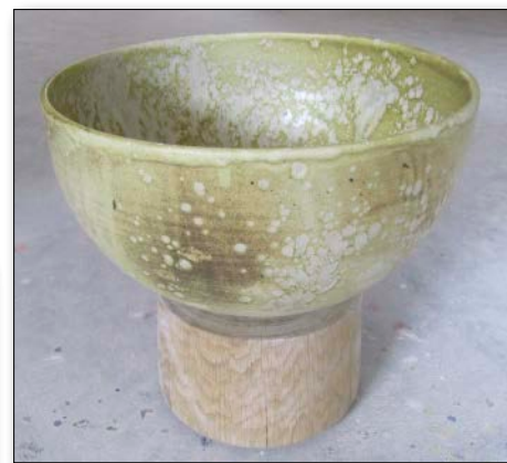
Den færdige pokal

Udvendigt vil pokalen fremstå glat i en brungylde nuance. Indvendigt vil overfladen være okkergylde. Som et lille kuriosum kan den fremtidige heldige vinder tænke på, at kronprinsen i det saudiske kongehus har 800 tallerkener i nøjagtig samme nuance.