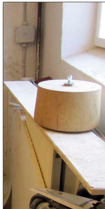
Den færdige fod i Aages værksted