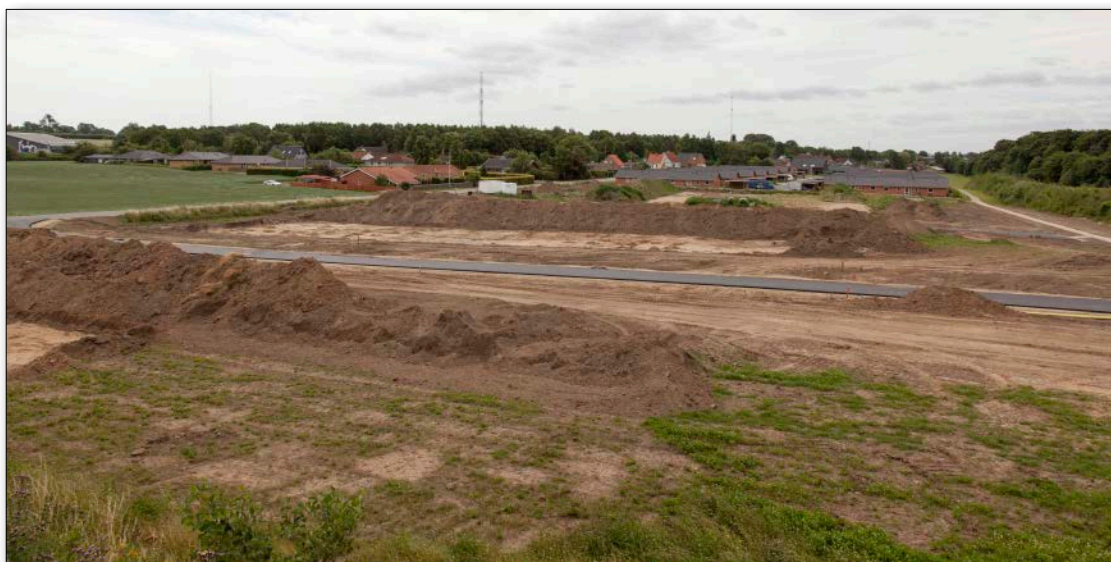
Udgravning ved den nye udstykning i Hattings nordlige ende, kaldet byg- og havrevej