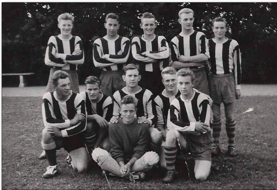
1. holdet fra 1960

Man blev enige om, at der skulle være 3 mands udvalg, hvor alle 3 i udvalget skulle vælges af generalforsamlingen, at formanden fra hvert udvalg skulle