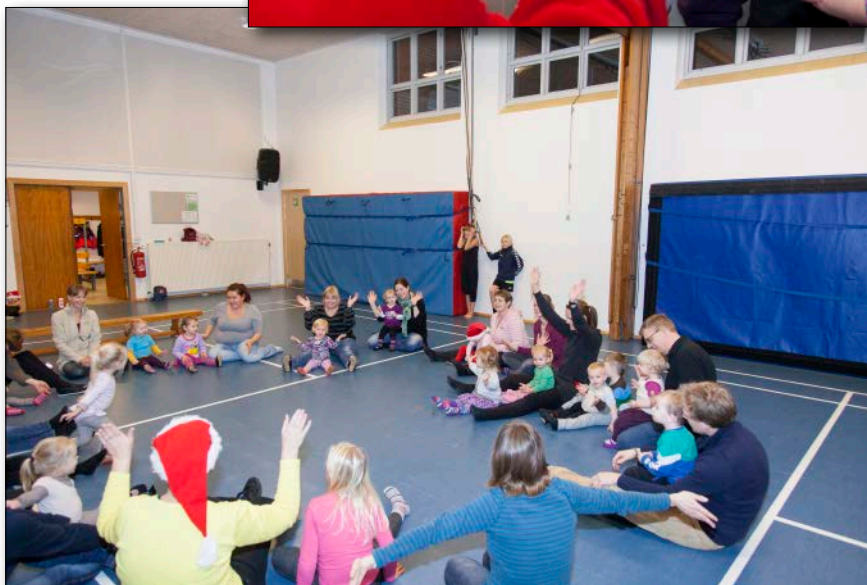
Juleafslutning for forældre- og barn gymnastik