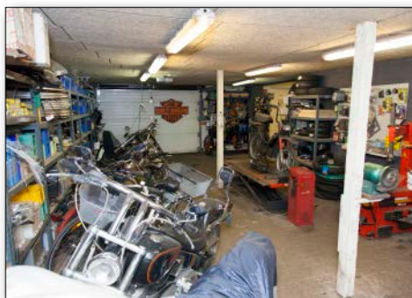
Ovenfor: Stort varelager og reservedele til de fleste mærker cykler og scootere

nødvendige reservedel på lager, så kunden ikke skal mangle sit køretøj.