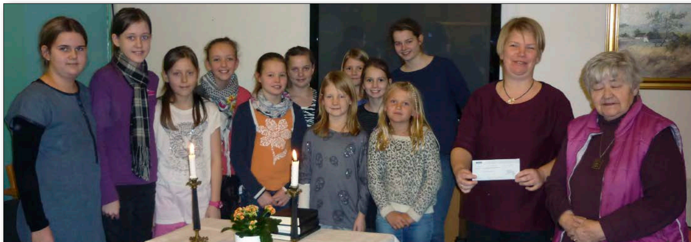
Herunder: Billede fra overrækkelsen af checken til børnekoret

Det var en rigtig festlig Gudstjeneste hvor børnekoret sang 2 sange. Efter Gudstjenesten var der kirkekaffe.