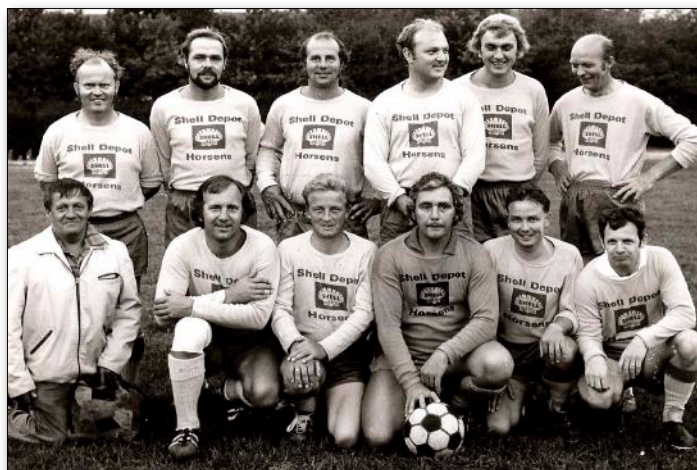
Ovenfor: Oldboys midt i 1970'erne. Bemærk flere af spillerne er gengangere fra 1. holdet i 1960