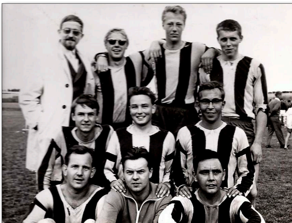
Håndbold egnsmestrene fra 1967

Her spillede de indtil 1996, hvor Hatting Idrætsforening gik med i en sammenslutning med 2 andre klubber. Det var målet at denne samlede klub, ved navn BTK96, skulle være en elite bordtennisklub, det var kun de bedste 30 aktive fra Hatting, der kom med i eliteklubben.