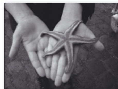
Fundet! En femtakket søstjerne kom i nettet ved Husodde Strand.

Der har været klasser på Horsens havn, hvor Galathea var på besøg. Der har været elever på Industrimuseet, hvor de lavede forsøg om og med vand i samarbejde med htx-stude-