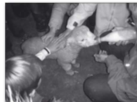
Når sådan en lille fyr får flaske smelter ethvert barnehjerte.