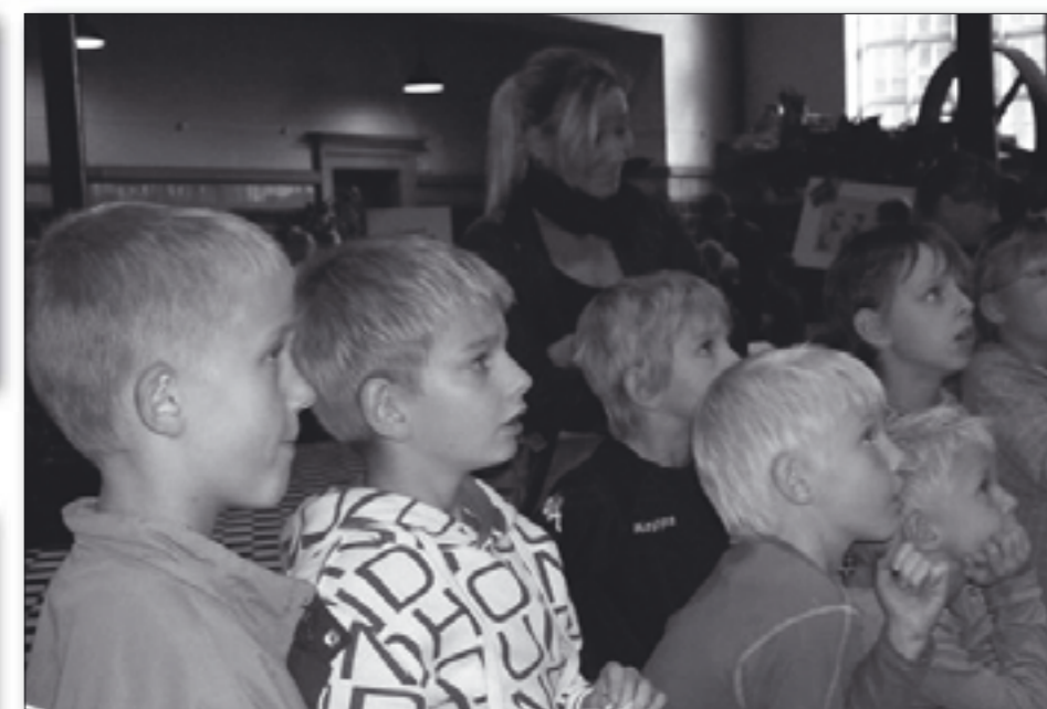
Sammen med studerende fra Vitus Bering htx lavede Hatting-eleverne forsøg med vand på Industrimuseet.