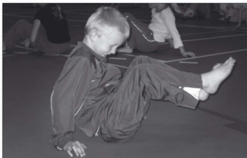
Gymnastik kan godt være anstrengende, men det er sundt for både børn og voksne.

stikkaravane mange skumredskaber, og flere team-tracks.