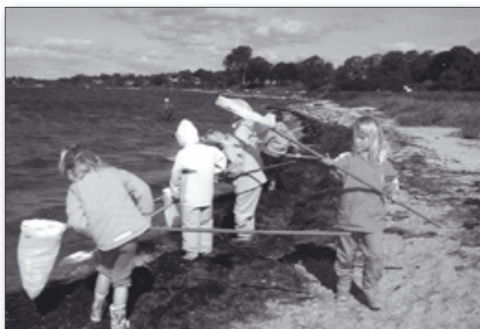
Er der mon noget i nettet? En krible-krable-tur til Husodde er populær blandt eleverne.

I første kvartal af dette skoleår har lærerne og pædagogerne taget en række initiativer, der har betydet, at mange elever på skolen har fået oplevelser, der motiverer til læring.