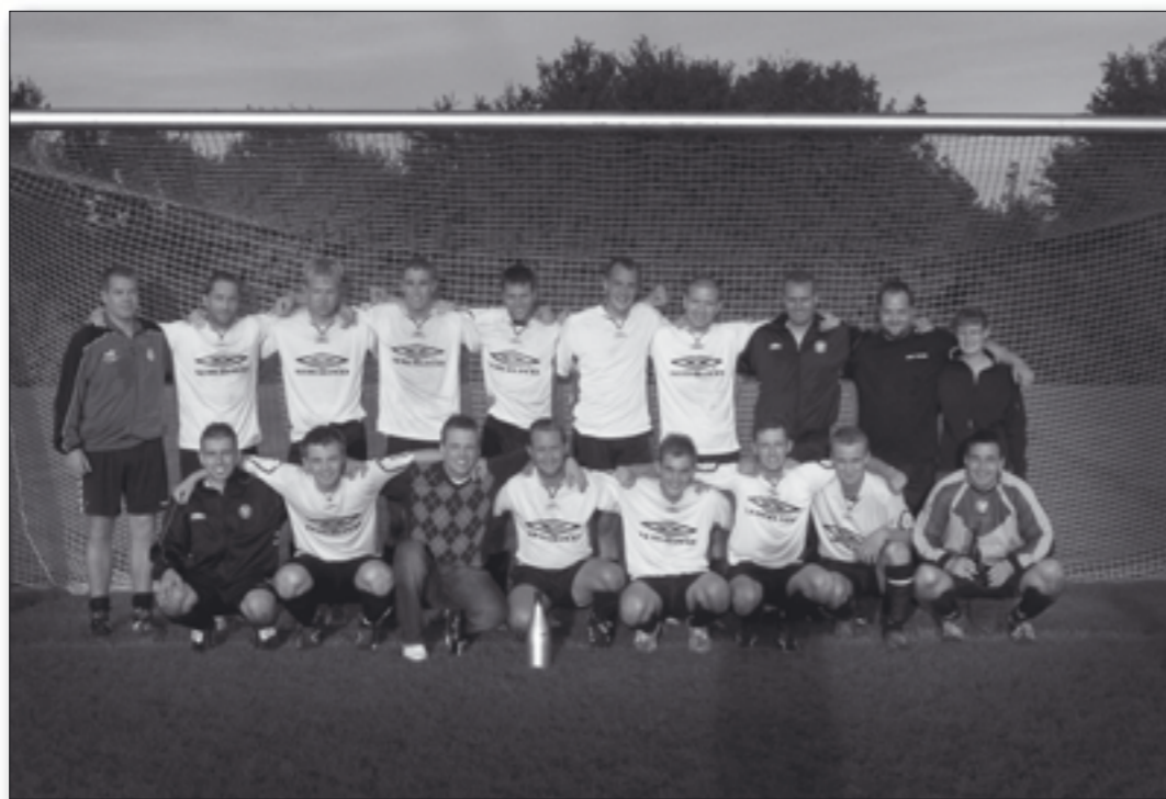
Hatting/Torstedes førstehold i herrefodbold sluttede sæsonen med en oprykning til serie et.