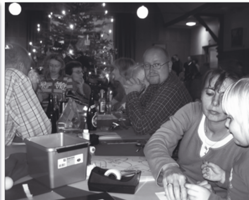
En af traditionerne ved den årlige juletræs-fest i forsamlingshuset er, at de mange gæster er flittige med papir og saks og pynter træet i fællesskab.