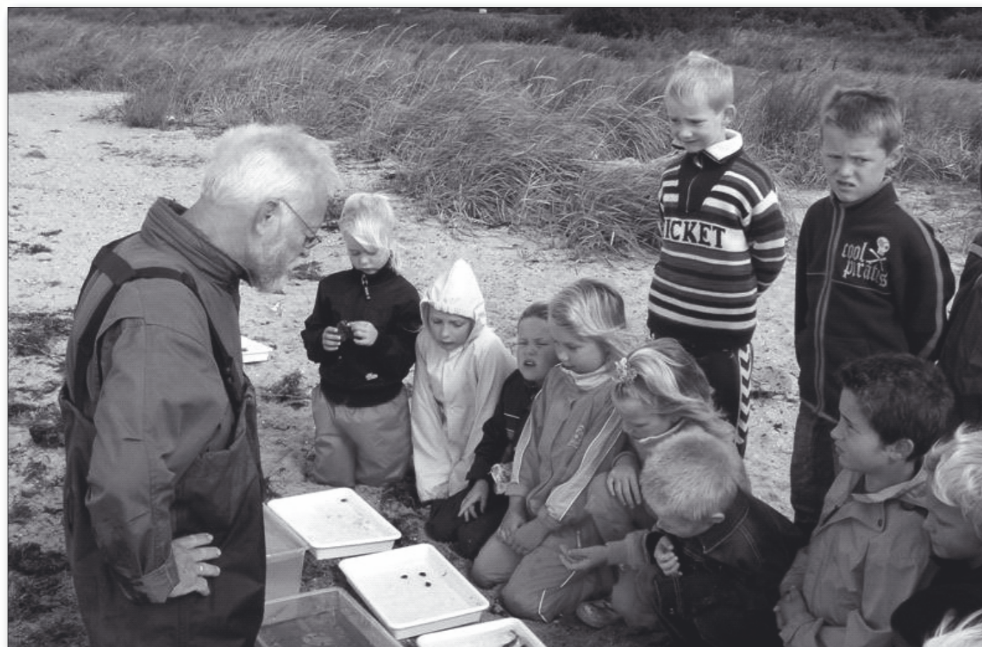
Frisk fjordluft i ansigtet og et nærstudie af plante- og dyreliv er klart at foretrække fremfor den indelukkede lugt af leverpostej i klasselokalet.