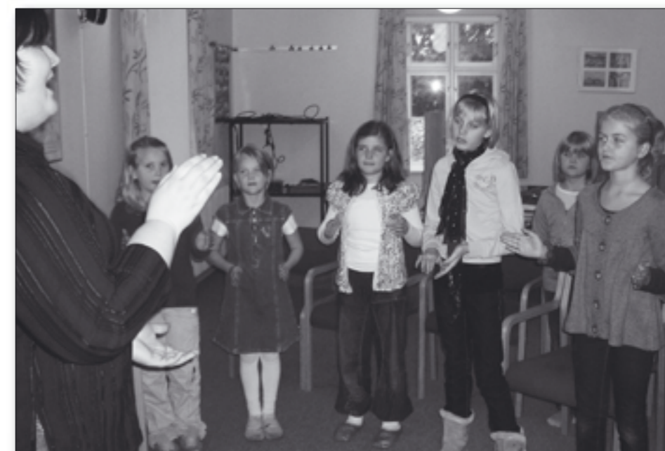
Der blev både klappet i takt og sunget ved kirkekorets workshop. Det blev en god dag, der sluttede med, at alle fik pizza.

fortælle om majs og majsens anvendelse, motiveres man uden tvivl i højere grad til at stille spørgsmål. Og mon ikke man husker mere af, hvad man hører, end hvis man sidder i klassen og hører læreren fortælle om majs?