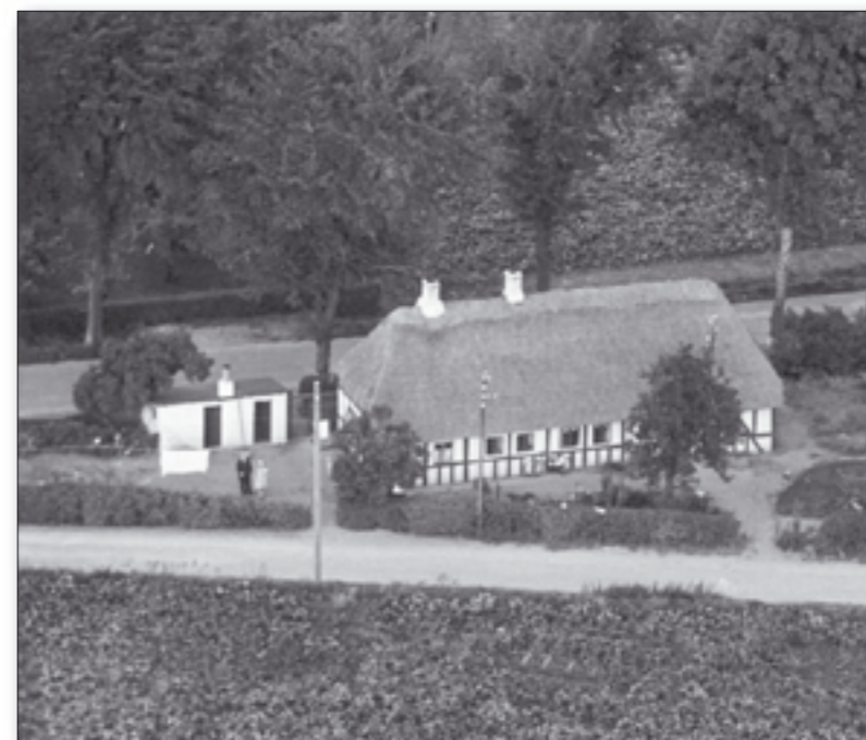
Adressen Kirkebakken 8, som det så ud fra luften, inden det idylliske bindingsværkshus blev revet ned i 1954.

Huset blev revet ned i 1954 og erstattet af det nuværende.