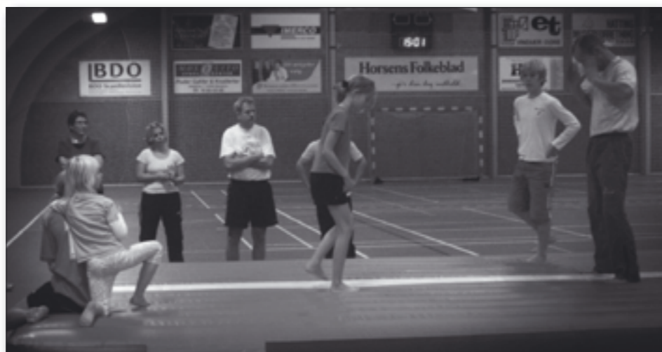
Skolen og gymnastikafdelingen var fælles om at invitere Gymnastikkaravane på besøg.

I spring og redskabs-aktiviteterne var der mulighed for at begå sig på Gymna-