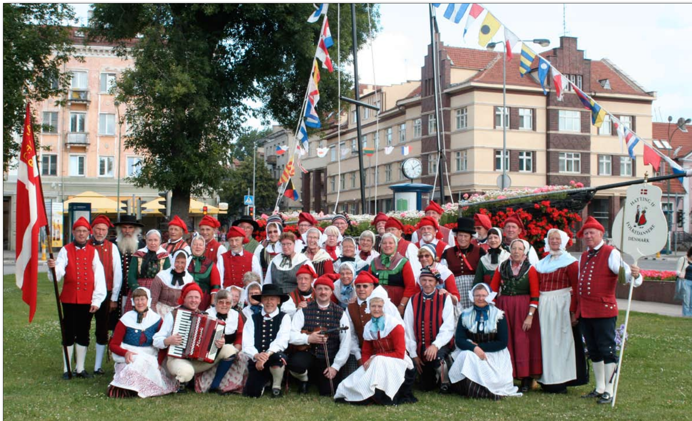
Hatting IF kan mønstre en imponerende flok deltagere ved den årlige folkedanserfest Europeaden.

Om torsdagen havde vi to opvisninger i byen, og om aftenen var der åbningsaften på stadion, hvor vi gav opvisning sammen med Horsens og Omegns og Fårup Folkedansere. Fredag tog vi på udflugt til en lille ø ca. 10 min. sejlads fra Klaipéda. Der havde de bygget akvarium med mange tusinde forskellige fisk, blandt andet med delfiner og søløver, som de gav