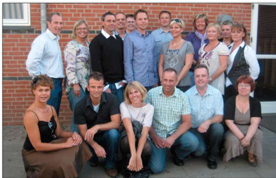
Der blev festet igennem, da en flok gamle elever fejrede, at det var 25 år siden, de forlod Hattingskolen.