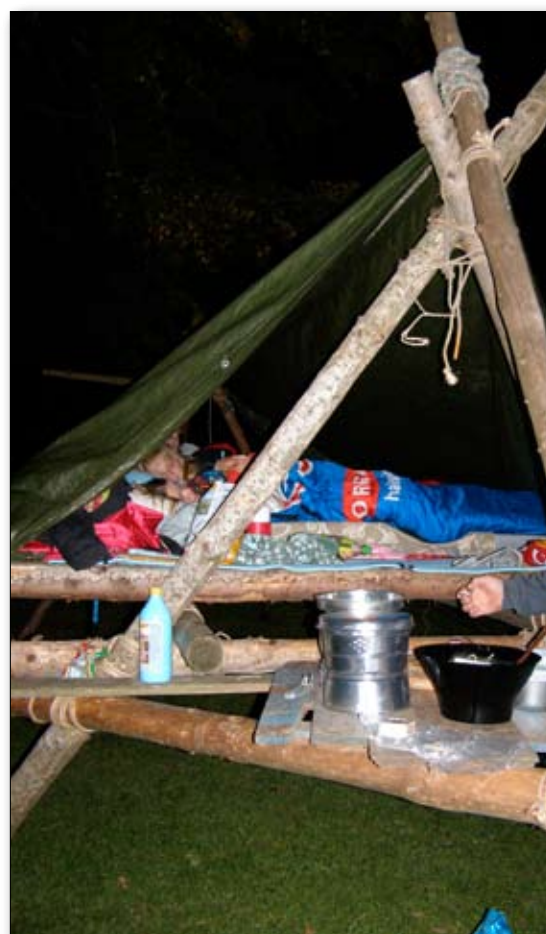
At sove i selvbyggede »huler« er en af de spændende ting ved at være spejder.

Imens de små var på byløb, var de ældste både i Skydeklubben, til selvforsvar, kanostaf-fet på Bygholm sø, og til geocaching i Bygholm park. Da Kuffertshowet var slut og bævere og ulve var på vej hjemad, var det de stores tur til at møde i Vesthallen. Der spiste de en frygtelig masse familiepizzaer og blev underholdt af De