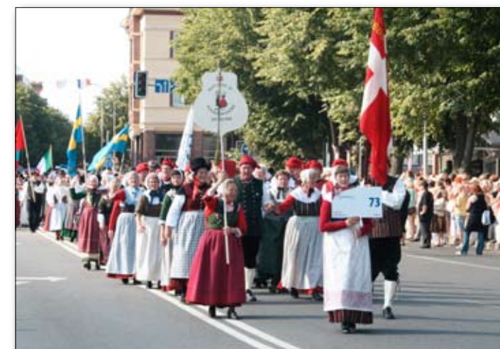
Tilskuerne stod tæt langs gader og stræder, da Europeade-deltagerne gik gennem byen.

Næste år afholdes Europeaden i Italien i byen Bolzano, som ligger i Sydtyrol. Og danserne fra Hatting IF er HELT SIKKERT med igen.