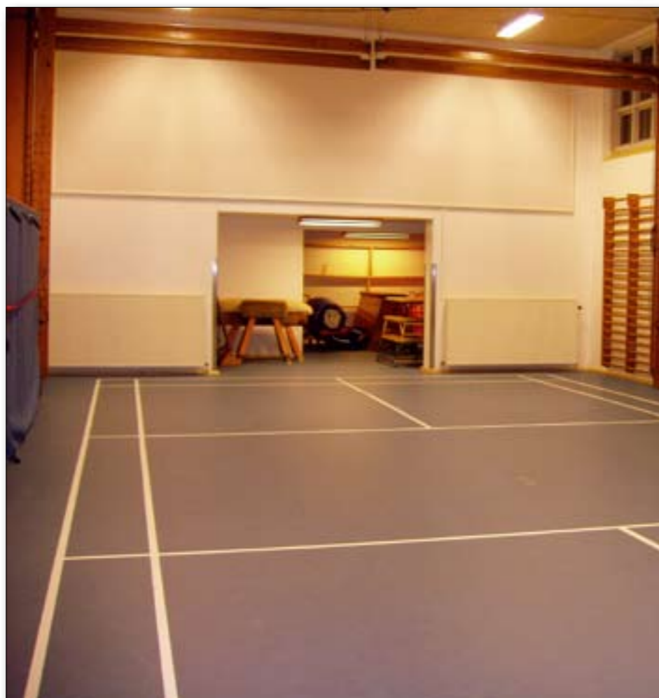
Det nye gulv i gymnastiksalen er populært hos gymnasterne. Nu slipper de nemlig for at få splinter i fødderne.

Der er stor tilslutning på voksenholdene, hvilket også viser et stort behov for udfordringer her. Til alle springglade juniordrenge og herrer, så kom frem! Vi kan tilbyde en time med god opvarmning, styrketræning, spring til ethvert passende niveau samt - det er aldrig for sent at "hoppe" på et hold, men kontakt