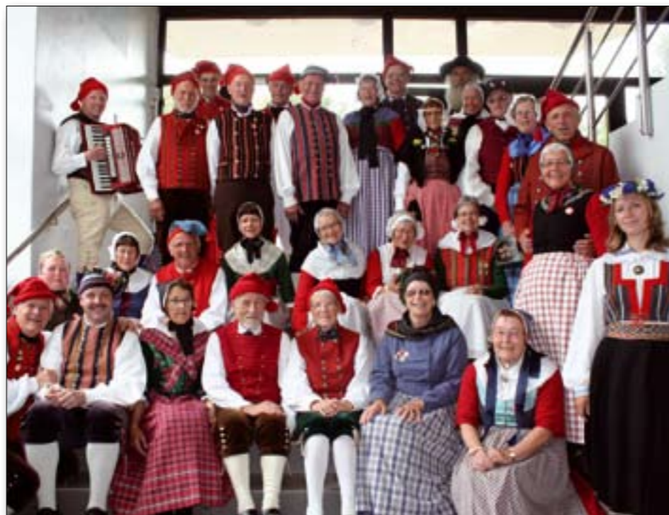
Europeaden i Estland var en af de bedste nogensinde. Mange dygtige unge estere hjalp til med den fortræffelige bespisning, og sørgede for at alting bare klappede. Nu ser Hattings mange folkedansere frem til Europeaden 2012, der holdes i Padova i Norditalien.

Fredag tog vi på udflugt, hvor vi fik rigtig mange oplevelser. Vi så flere gamle slotte, og vi var også ude at bade i den femte største sø i Europa, hvor Rusland var på den anden side af søen. Om aftenen var vi til korraften, som blev holdt i deres aula på universitetet.