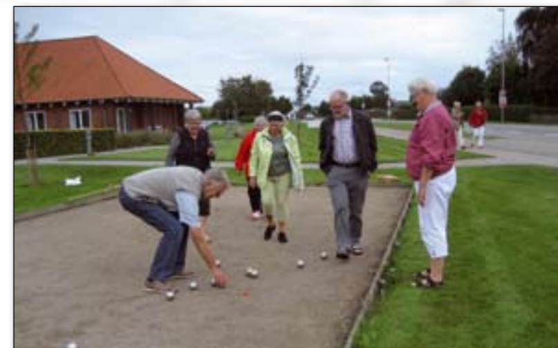
Der er kommet godt gang i kuglekastningen på petanquebanen ved Hatting Centret.

Petanquespillet får alle drillepindene op i gear. Der er ikke noget sjovere, end at skyde de andres kugler væk! Så kom gerne med til starten i 2012 engang i slutningen af april. Tilmelding til centeret – eller mød op og prøv et spil! Petanque er gratis, når man har et aktivitetskort til centeret.