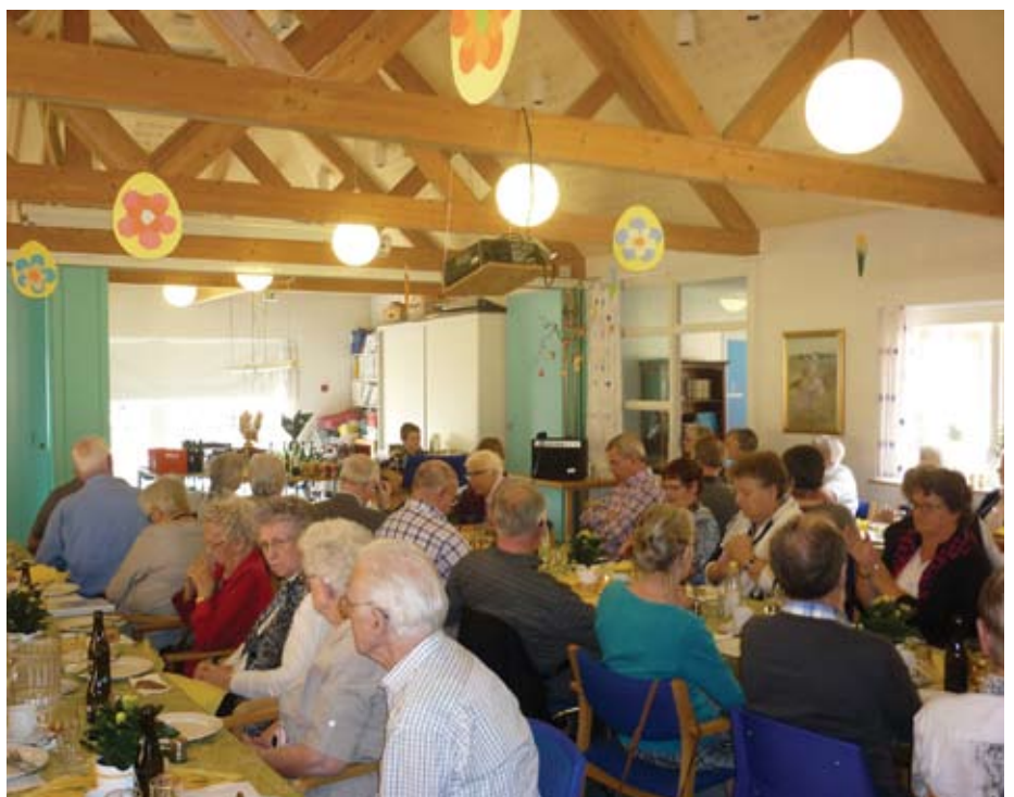
Påskefrokosten, hvor alle så ud til at have en hyggelig dag.

Den 18. april havde vi indvielse af den nye bane. 29 meldte sig til at spille petanque i denne sæson, og der kan stadig nå at komme nye med.