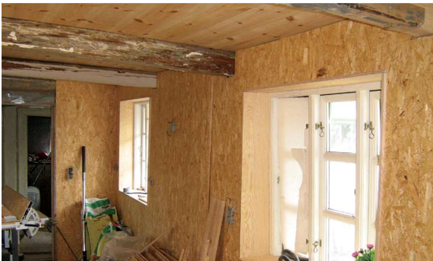
Her ses de grove spånplader og bag dem blæses papiruld ind.

rotte kunne drømme om at flytte, med så favorable vilkår? Et enkelt husdyr har vi dog haft, under det meste af byggearbejdet. En ældre hankat med hvid og rød pels. Han overnattede længe på vores loft med jævne mellemrum, og har sikkert medvirket til at holde andet utøj ude af huset. Nu er huset lukket mere af, og katten nøjes med at patruljere forbi. Han sender et bebrejdede blik, og så går han videre ind på kirkegården.