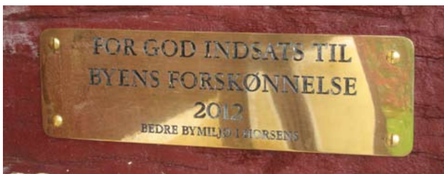
Årets plakette for "vellykket byggeri".

Vi arbejder videre, og skulle gerne nå at klare den udvendige del af udhuset, inden den næste vinter nærmer sig. Udhuset skal isoleres, taget skal hæves en lille smule, og gulvet sænkes lidt også. Også her er der temmelig undermineret, så med lidt held har rotterne fjernet en del af jorden, så der ikke skal køres så meget ud af huset. Hvis I er lidt nysgerrige over, hvad vi går og laver, så kom bare ind og se selv.